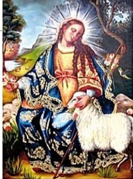
A fianco, san Giacomo maggiore (patrono di Spagna), identificato dagli incas con il dio del fulmine e del tuono; sopra e sotto, altre due immagini della Vergine Maria.