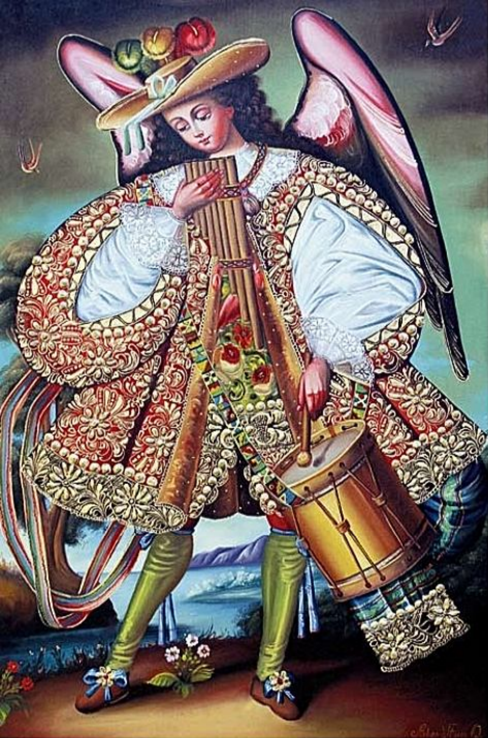
A fianco, l'Arcangelo suonatore di zuplo e tamburello (portatore di allegria). Sotto, l'Arcangelo sbandieratore Gabriele (protettore della famiglia).

donna, che in questo modo ricorda l'aspetto di una montagna, personificazione più evidente della Madre Terra. Le diverse immagini dell'iconografia mariana, perciò, soprattutto quando è accompagnata da Gesù Bambino, si associano all'idea della protezione che l'uomo andino riceve dalla Madre Terra che, oltre ai suoi prodotti per alimentarsi, gli offre la propria ospitalità per proteggersi.