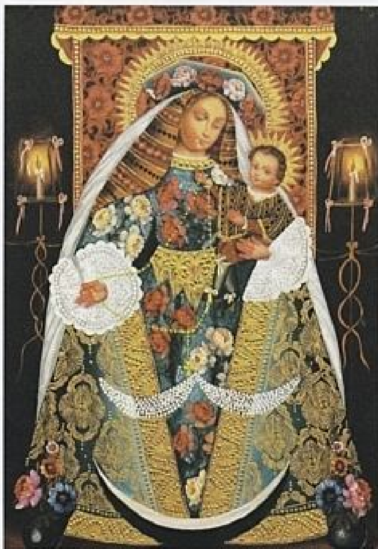
Lo sontuosa Madonna del Rosario, magnifico esempio di pittura andina barocca, o "mesticcia", della scuola peruviana di Cuzco.

I primi pittori che giunsero in Perù nella seconda metà del Cinquecento erano italiani o spagnoli, e per lo più appartenenti a ordini religiosi. La loro arte, infatti, si poneva soprattutto al servizio dell'apostolato, come formidabile strumento di predicazione, così come secoli prima, nell'Europa delle basiliche e delle cattedrali, gli affreschi e le vetrate erano state la "Bibbia" del popolo illetterato. Ben presto, però, soprattutto i missionari ge-